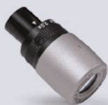
EyeZoom™ Mini 2.5x - 3.5x

Questa ottica innovativa garantisce all'utilizzatore l'ingrandimento ottimale per ciascuna procedura di lavoro.