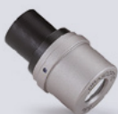
HDL™ 3.5x Prism

HDL™ Prism permettono interazioni precise, una maggiore visibilità ed un comfort personalizzato.