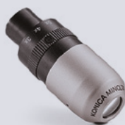
EyeZoom™ 3.0x - 4.0x - 5.0x

EyeZoom™ offre un ingrandimento variabile da 3x a 5x. Sviluppato per assistere i professionisti del settore a vedere il campo operatorio da diverse prospettive, assecondando le più svariate preferenze di ciascuna persona.