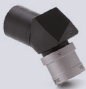
HDL™ ERGO 3.5x

La linea Ergo è un'opzione ergonomica che offre comfort per tutto il giorno.