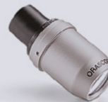
HDL™ 5.5x Prism