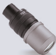
EyeZoom™ Max 3.5x - 6.5x

Le generose dimensioni del campo dell'ingrandimento 3.5x, combinate con la capacità di eseguire procedure impegnative utilizzando l'ingrandimento 6.5x, creano un'esperienza d'ingrandimento versatile.