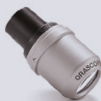
HDL™ 4.5x Prism