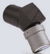
HDL™ ERGO 5.0x