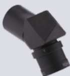
RDH Ergo™ 3.0x

I prismi refrattivi permettono ai professionisti di mantenere una postura corretta per tutto il giorno riducendo anche i dolori al collo e preservando nel lungo periodo la carriera.